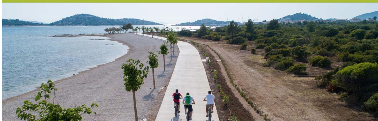
web str vodice-hr