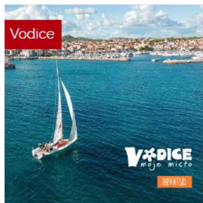
Image brošura Vodice tiskana je 5 jezičnih verzija u nakladi od 7000 kom. Brošura Doživi Vodice, Info, video materijal nisu realizirani u 2022.g. te su izmjenama i dopunama plana brisani iz programa. S obzirom da je u prethodne dvije godine naklada bila dostatna za cijelo razdoblje, to se u 2022.g. Doživi Vodice nije reprintala. Video materijal napravljen prethodne godine, korišten je i u 2022.g., a sufinancirana je izrada videomaterijala za tur.usluge (druga stavka - potpore), te materijal za V. Mrdakovicu (druga stavka ) za projekt.

Vodice (hr) (6,2 MB) Vodice (en) (6,2 MB) Vodice (de) (6,2 MB) Vodice (it) (6,2 MB) Vodice (fr) (6,2 MB)